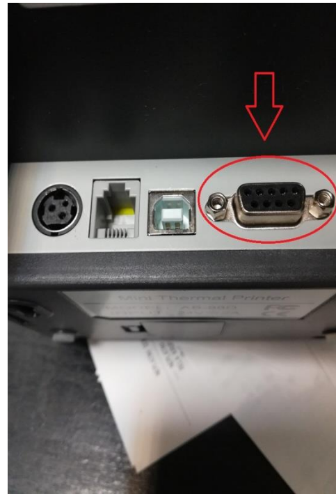
Sériový port tlačiarnie