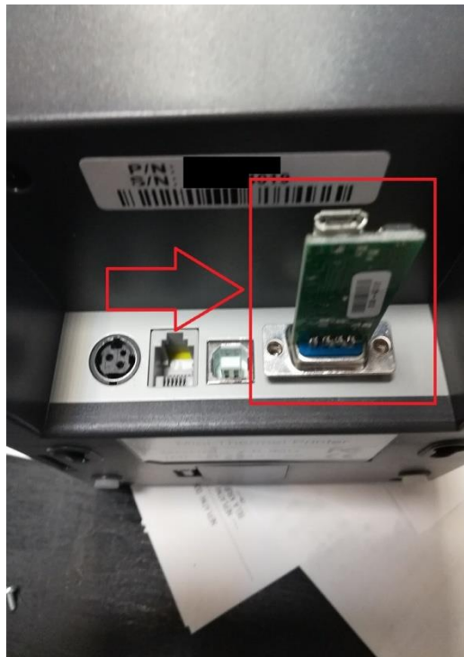
Pripojenie CHDÚ k tlačiarni