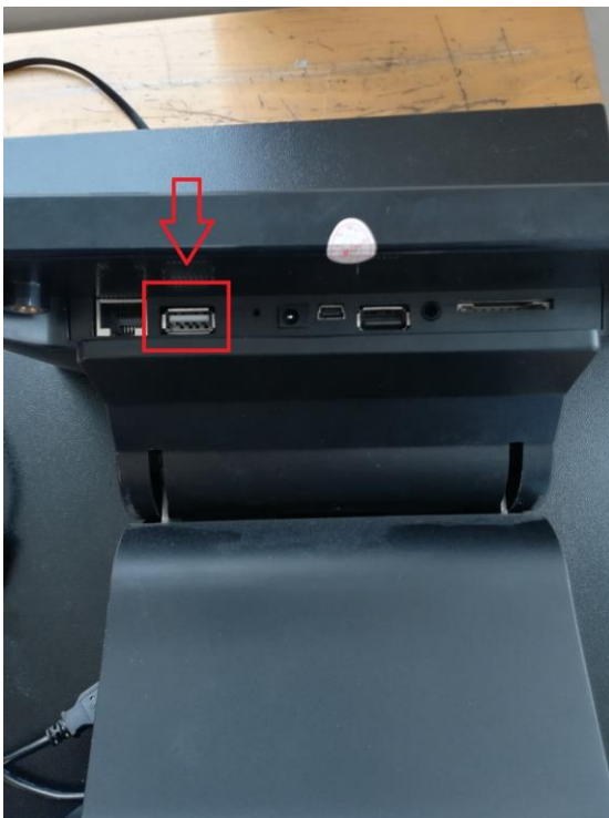
USB port tabletu

5. Druhú stranu micro USB kábla pripojíme do USB portu tabletu.