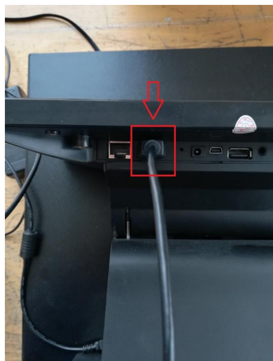
Pripojenie USB kábla k tabletu